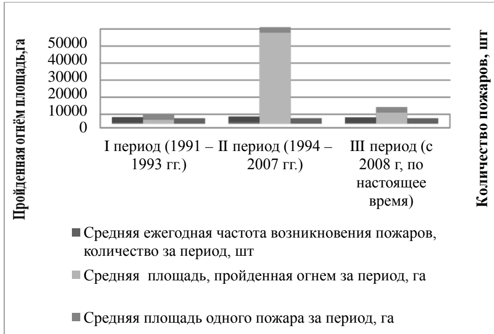
Рис. 2. Лесопожарные периоды в Казахстане в период независимости

Главной причиной лесных пожаров в сосняках Казахского мелкосопочника является антропогенная. Наиболее горимым за период исследований оказался лесной фонд ГНПП «Баянаул» (табл. 1).