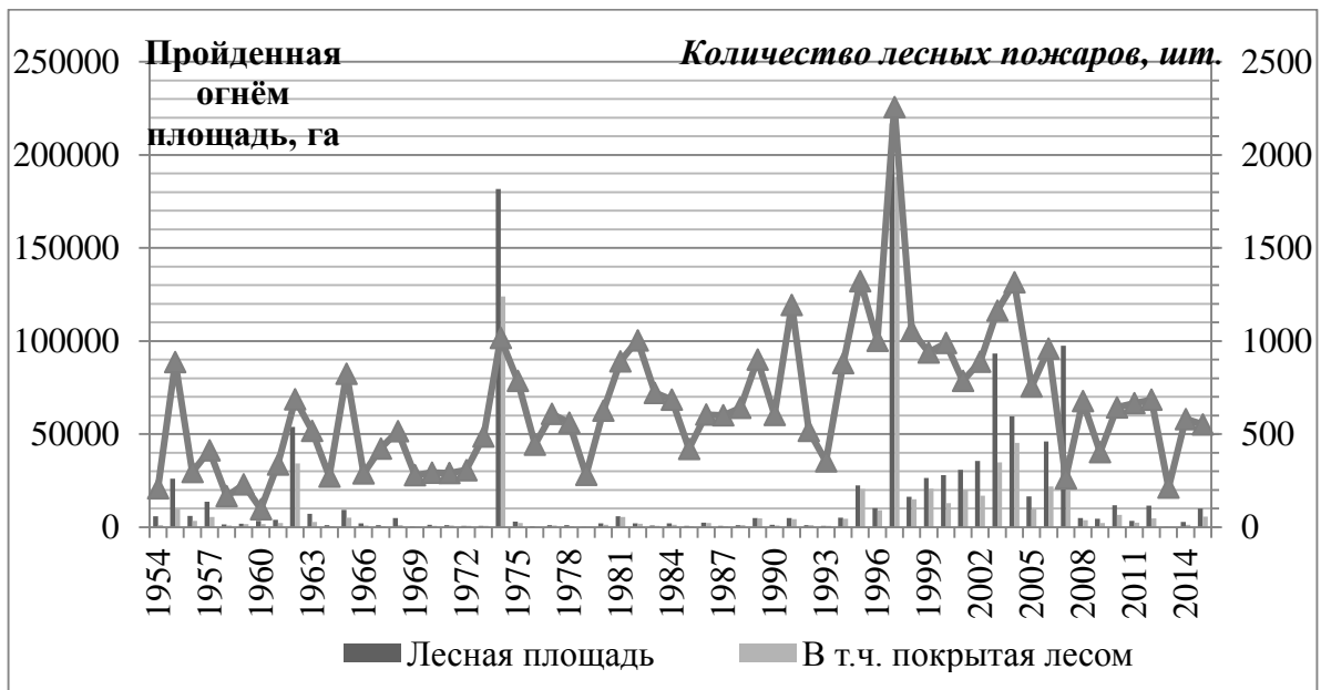
Рис. 1. Динамика площади лесных пожаров и их количества

После распада СССР, с 1995 г., ситуация с охраной лесов от пожаров начала ухудшаться по 2007 г. включительно (рис. 2).